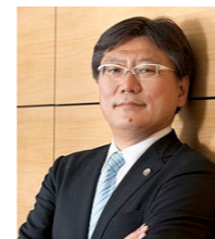
NPO法人 遺言相続リーガルネットワーク 事務局長

弊社でもお客様にこれらの課題に円滑に対応できるように「監査による課題抽出」や「電子申請100%実現」に向けたプロジェクトを発足し活動を開始します。お客さまにとって最高の成果につなげられるよう、そして3年後、5年後を見越した未来志向のお手伝いができるようスタッフ一丸となって取り組んでいきます。本年もどうぞ宜しくお願い申し上げます。